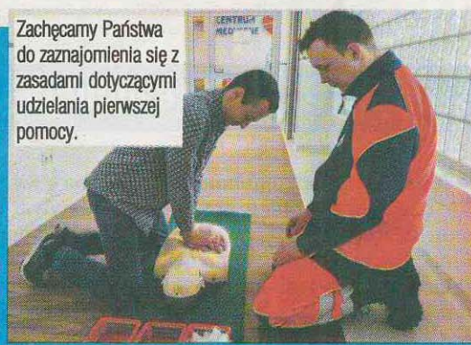
Zachęcamy Państwa do zaznajomienia się z zasadami dotyczącymi udzielania pierwszej pomocy.