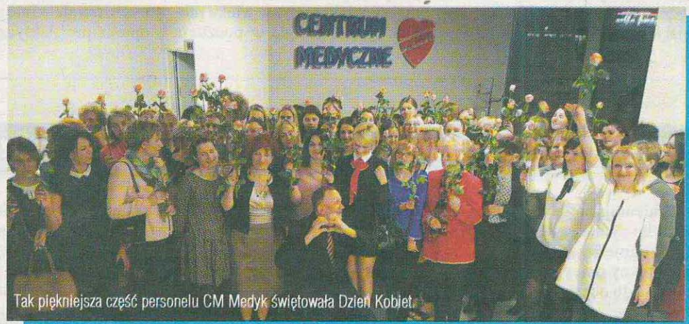
Tak piękniejsza część personelu CM Medyk świętowała Dzień Kobiet.