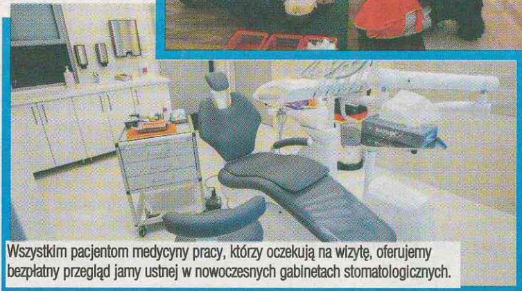
Wszystkim pacjentom medycyny pracy, którzy oczekują na wizytę, oferujemy bezpłatny przegląd jamy ustnej w nowoczesnych gabinetach stomatologicznych.